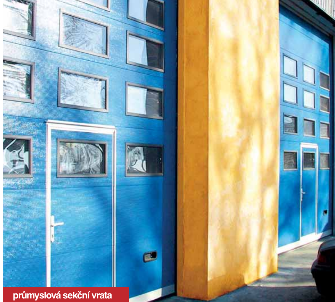
průmyslová sekční vrata